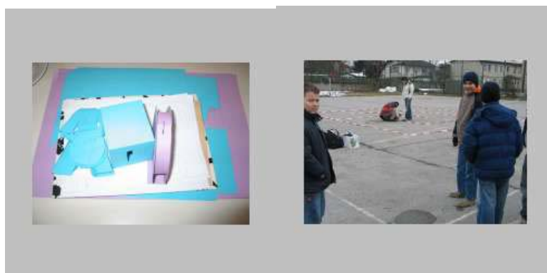
Izdelki iz papirja in tekmovanje RV avtomobilov