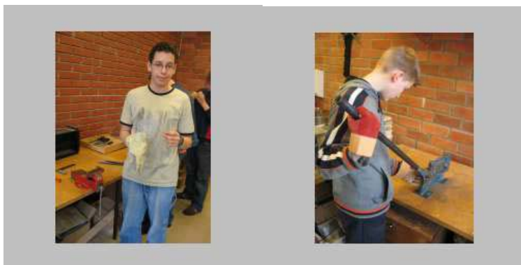
Izdelki iz kovine