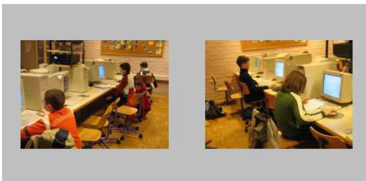
Tekmovanje v ciciCADu