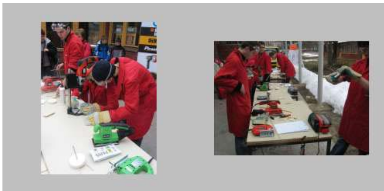
Izdelki iz lesa