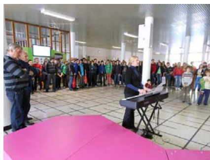
Utrinki ob otvoritvi 35. srečanja MT 2012